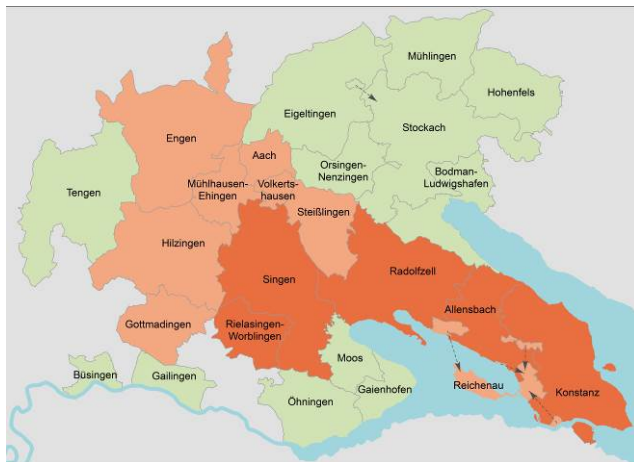
Raumkategorien nach dem Landesentwicklungsplan 2002 Baden-Württemberg

Das Entwicklungsprogramm Ländlicher Raum (ELR) des Ministeriums für Ländlichen Raum und Verbraucherschutz (MLR) zählt zu den wichtigsten Instrumenten des Landes Baden-Württemberg, um die Strukturentwicklung von Gemeinden / Kommunen zu unterstützen. In den Dörfern und Gemeinden des Ländlichen Raums sollen Lebens- und Arbeitsbedingungen erhalten und fortentwickelt werden. Das Programm soll der Abwanderung entgegenwirken und den landwirtschaftliche Strukturwandel abfedern. Der sorgsame Umgang mit den natürlichen Lebensgrundlagen steht hierbei im Vordergrund. Die Fördermittel sind begrenzt, daher kann leider nicht jeder Antrag, der formal den Richtlinien entspricht, bewilligt werden. Ein Rechtsanspruch besteht nicht.