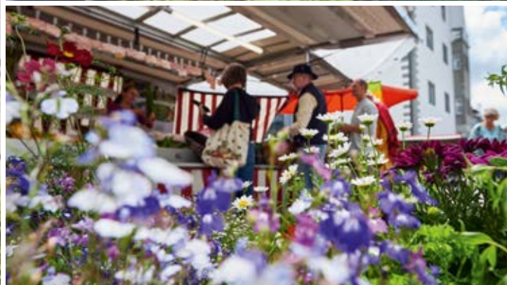
Belebter Marktplatz mit Münster an einem Markttag ◇ A lively market day on the market square at the Münster