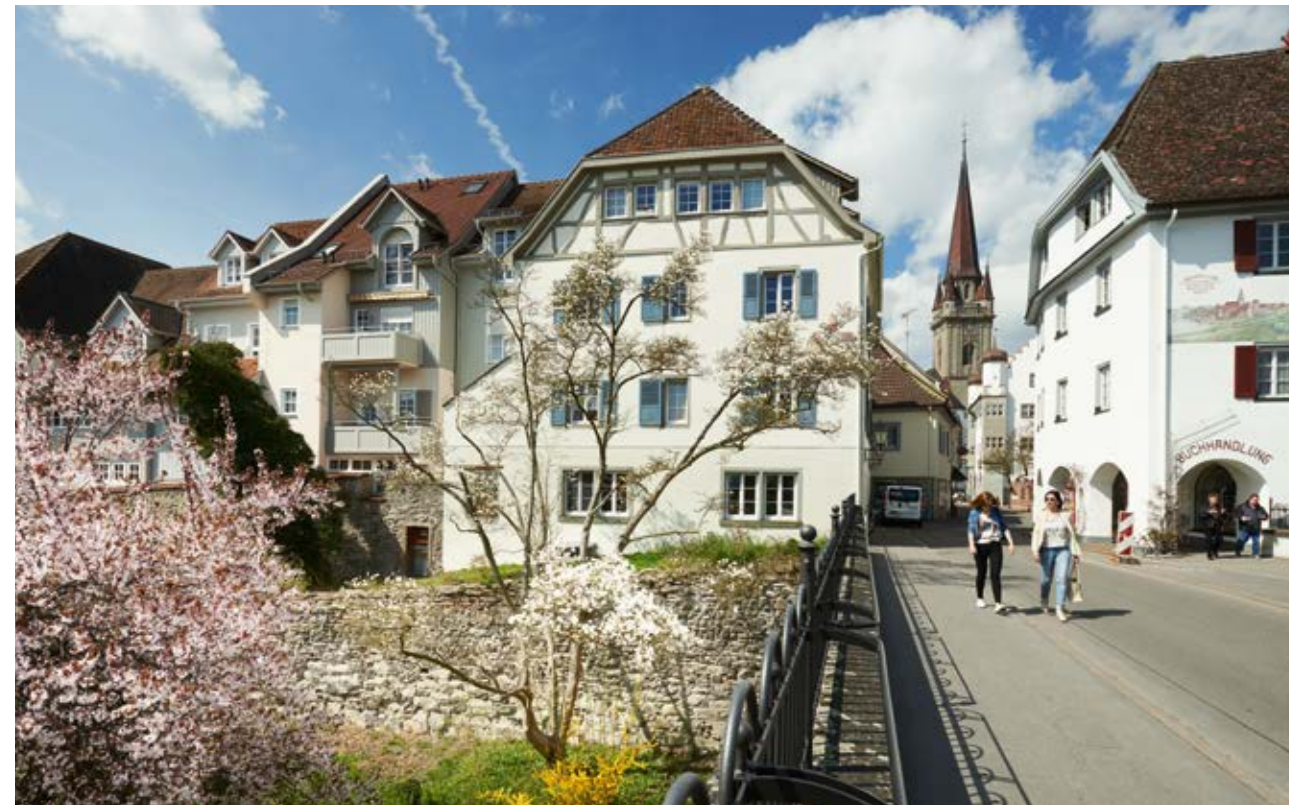
Radolfzell bietet mit seiner lebhaften Innenstadt und der seenahen Lage viel Lebensqualität für seine Bewohner und Besucher.