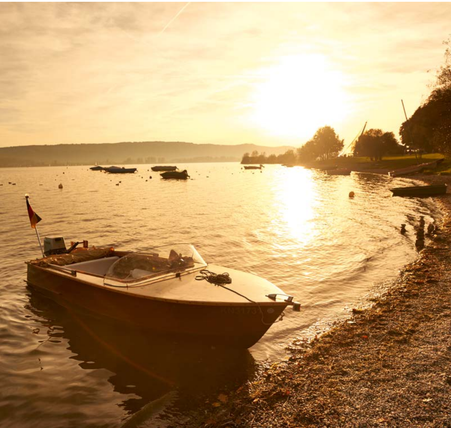
Uferbereich am Konzertsegel ◊ Shore area by the Konzertsegel (concert sail)