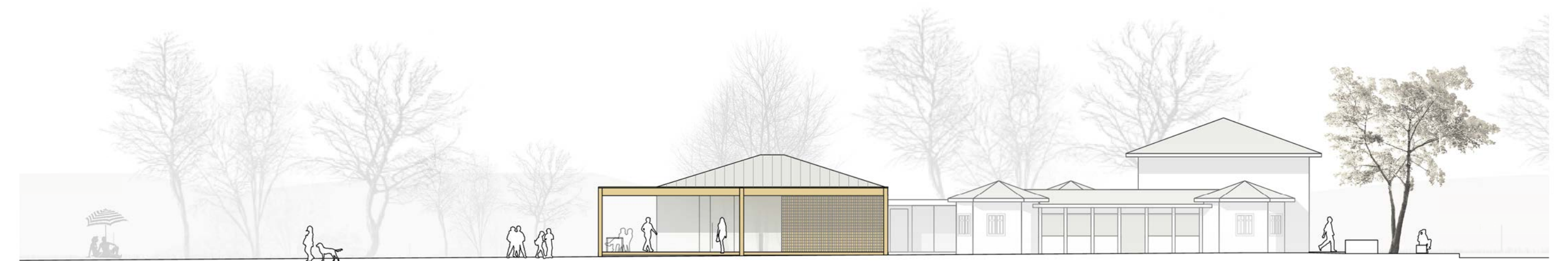
Ansicht Ost M 1:200