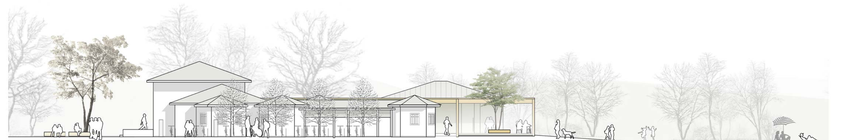
Ansicht West M 1:200