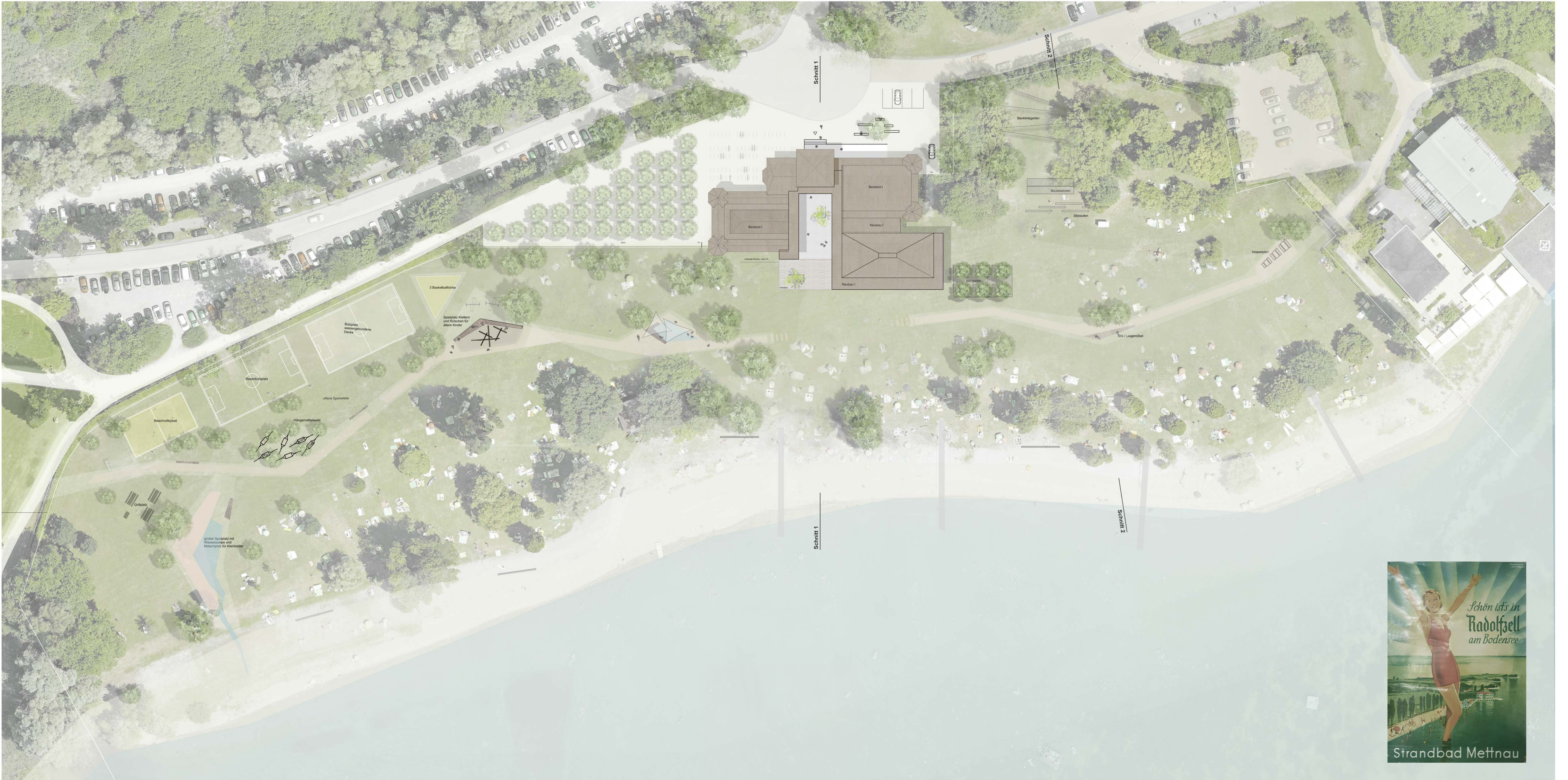
Lageplan - Frei- und Grünflächenkonzept M 1:500