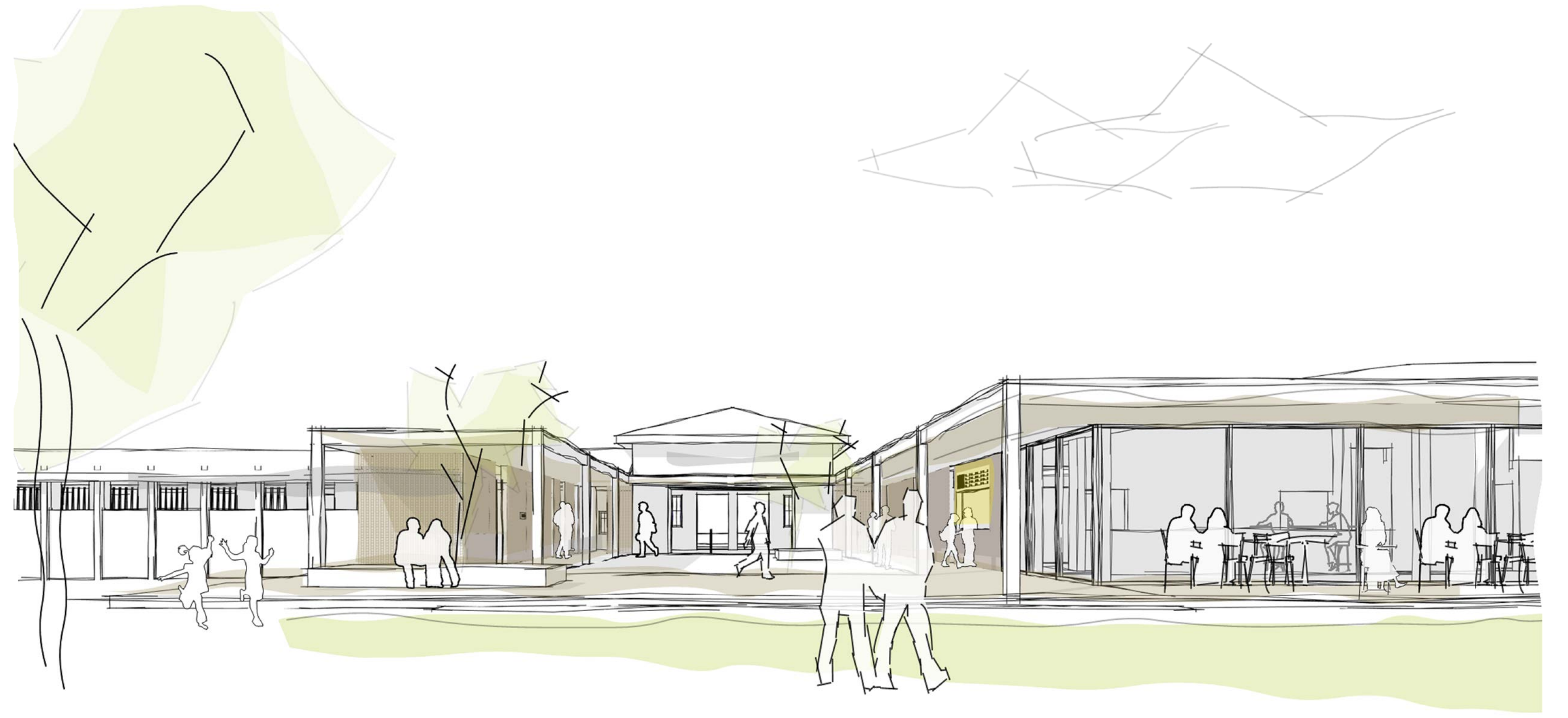
perspektivische Skizze Hof