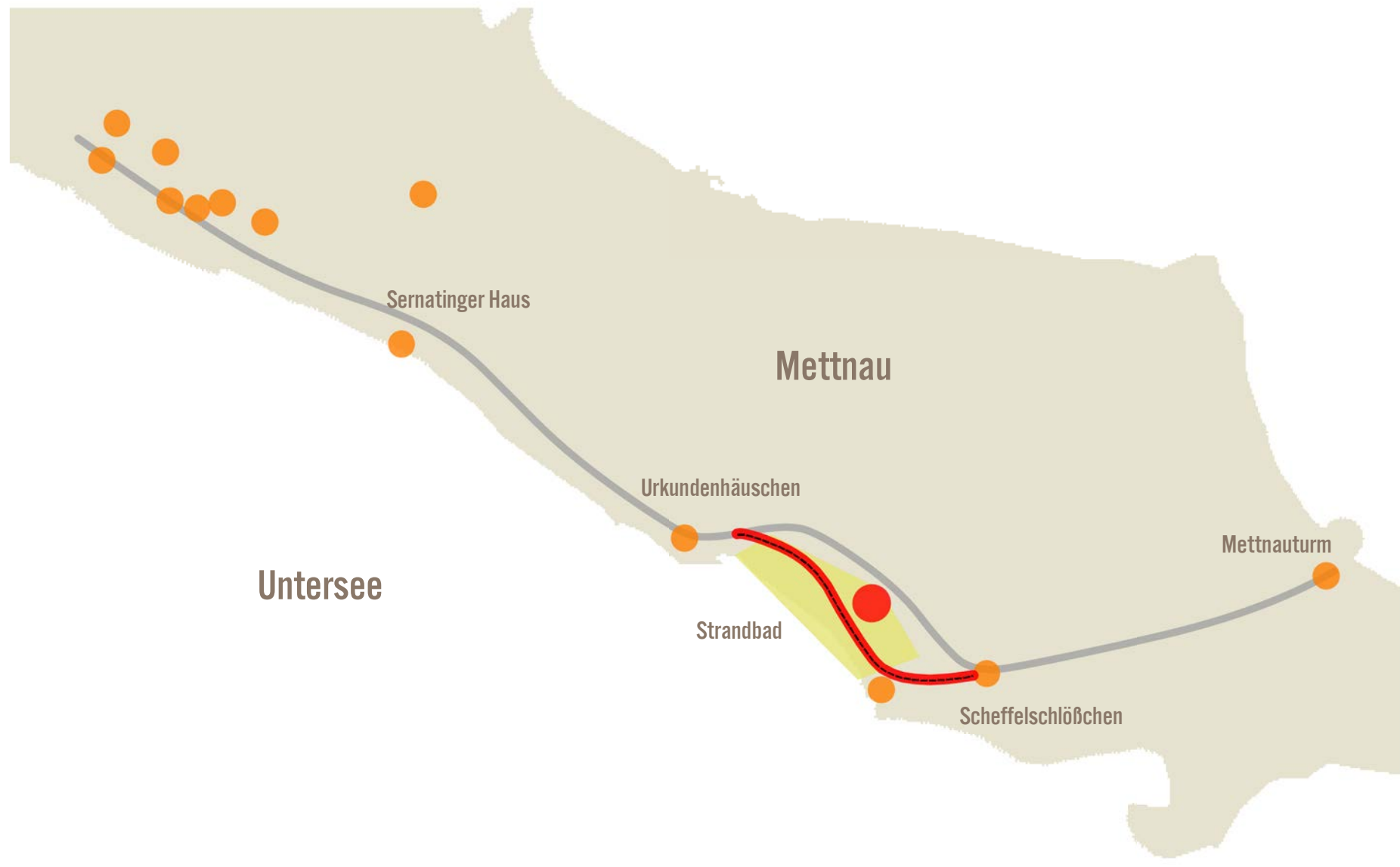
Wegebeziehung und räumlicher Zusammenhang