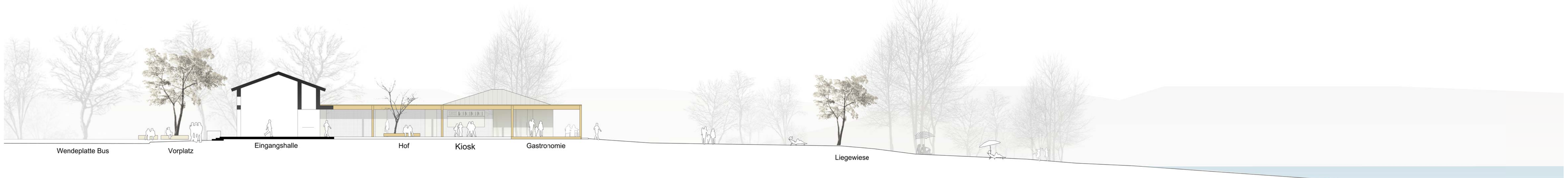
Schnitt 1 M 1:200