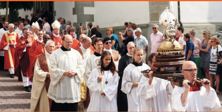
Prozession mit den Reliquien der drei Hausherren

Die Stadt Radolfzell ehrt jeweils am dritten Wochenende im Juli ihre „Hausherren“ mit einem eindrucksvollen Fest. Dieses bildet sowohl christliche wie weltliche Aspekte ab.